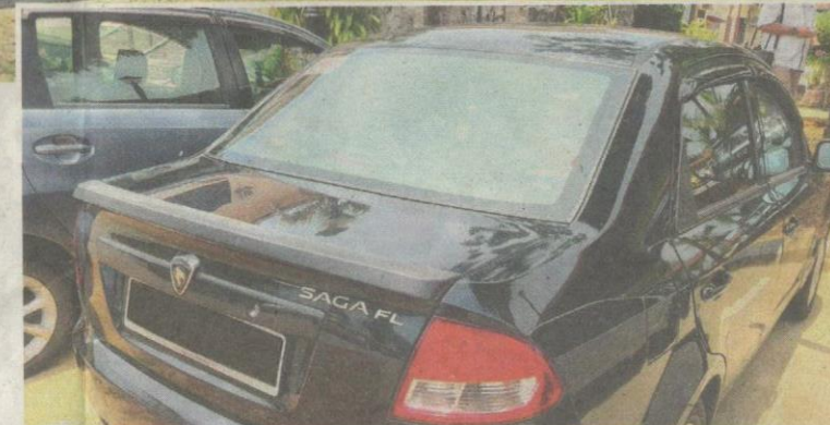
INILAH kereta seorang pensyarah yang tertinggal anaknya menyebabkan mangsa meninggal dunia dalam kejadian di Port Dickson semalam.